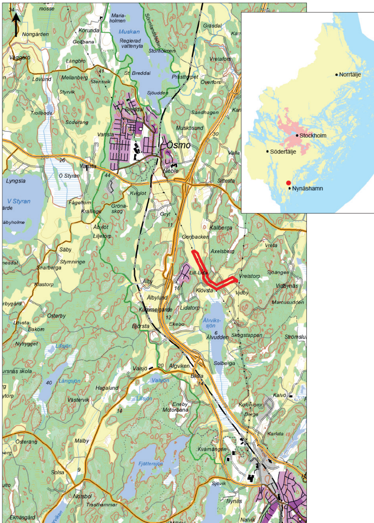
Figur 1. Utredningsområdet markerat med röda linjer. Utdrag ur Terrängkartan. Skala 1:50 000.